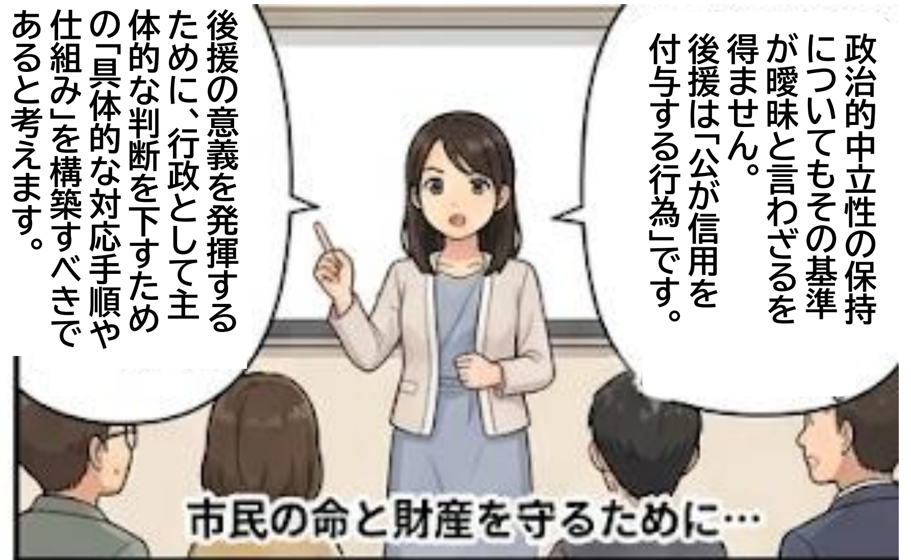
8 市民福祉増進への責任