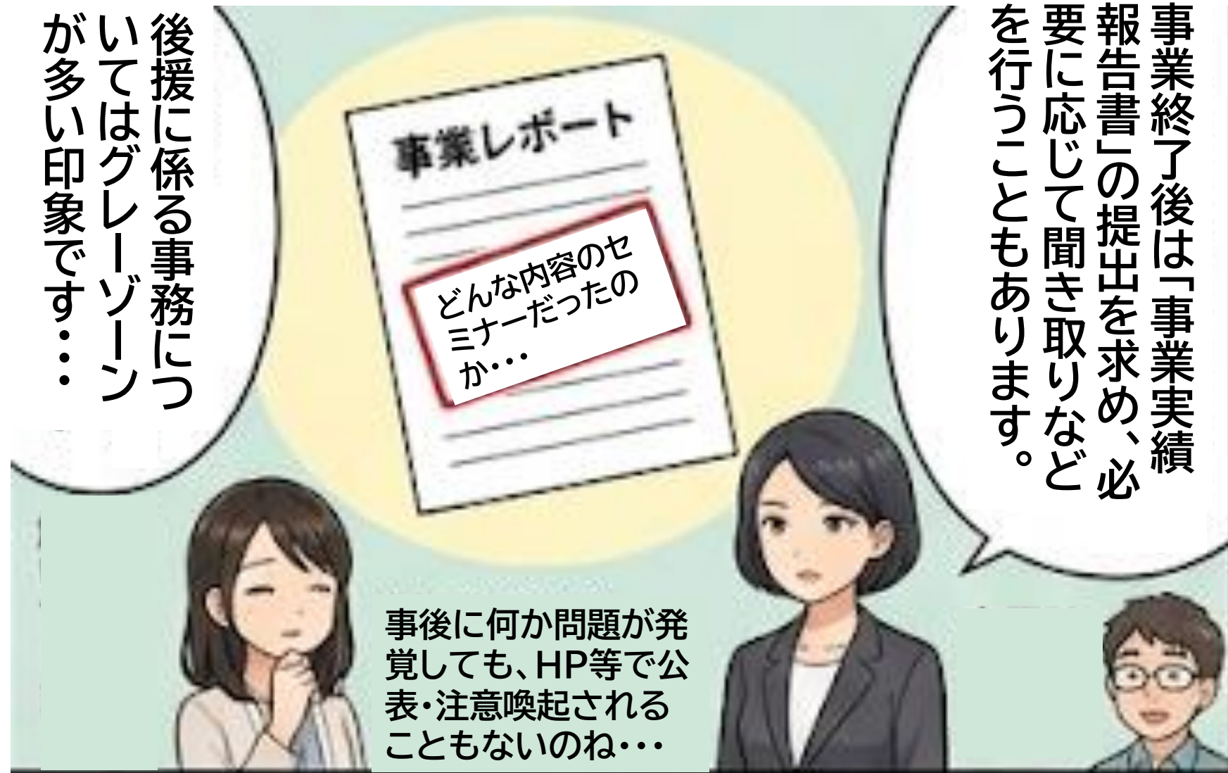
7 事後確認の現状とリスク