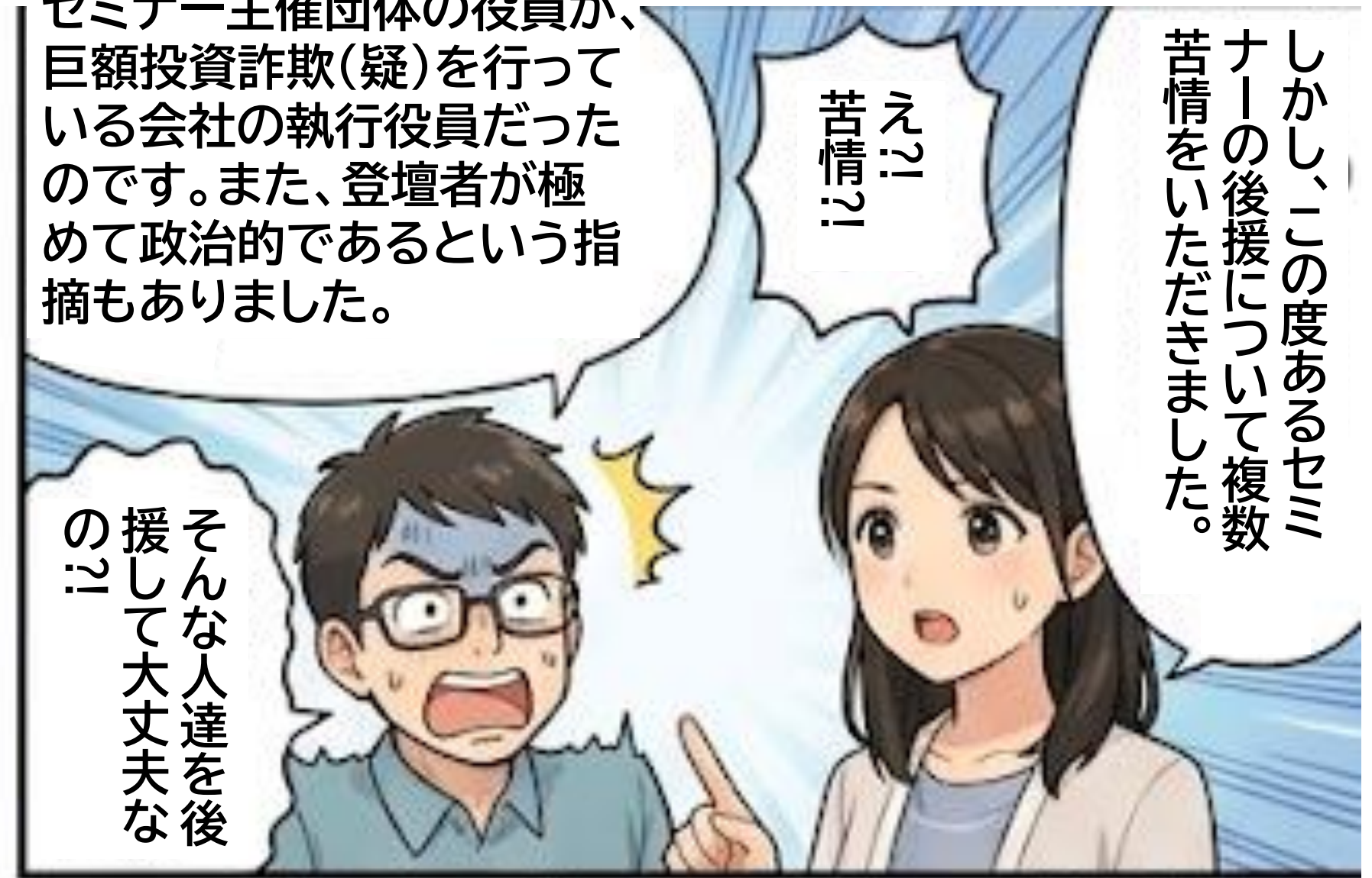
2 過去の後援事例への苦情

セミナー主催団体の役員が、巨額投資詐欺(疑)を行っている会社の執行役員だったのです。また、登壇者が極めて政治的であるという指摘もありました。