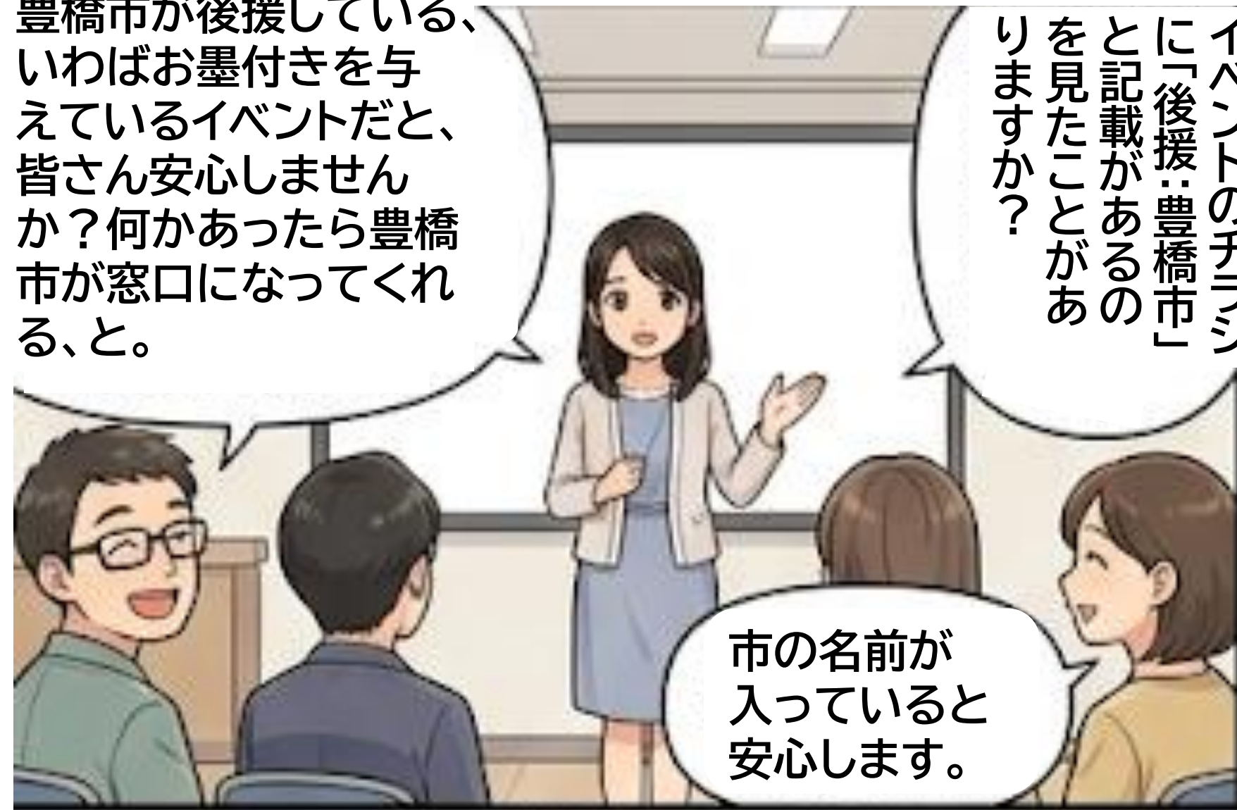
1 市政報告会 開催

豊橋市が後援している、いわばお墨付きを与えているイベントだと、皆さん安心しませんか？何かあったら豊橋市が窓口になってくれる、と。